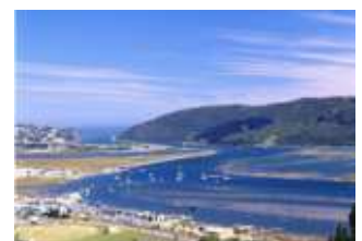
Laguna di Knysna

Sveglia e partenza verso Knysna , una cittadina che sorge su una laguna di acqua calda. Qui avrete il tempo di rilassarvi un pochino sul lungomare ed effettuare una bellissima attività all'aperto nella riserva naturale Featherbed (non inclusa nel preventivo). Qui le possibilità sono numerose: dalla gita in battello lungo la laguna all'escursione in auto verso la parte alta della riserva o per chi volesse una semplice passeggiata lungo i sentieri naturali della riserva. Partenza per Plettenberg Bay per il pernottamento.