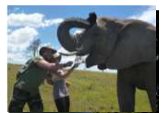
Parco Nazionale Tsitsikamma

Sveglia ed esplorazione del Parco Knysna Elephant . Qui vedrete intere famiglie di elefanti africani e grazie alle guide del parco scoprirete le tristi e mistiche storie del Knysna Elephants. Pochi luoghi al mondo offrono la possibilità di entrare in contatto con questi gentili "giganti" così da vicino ma in questo parco potrete toccarli, nutrirli e fotografarli. Dopo pranzo si riparte verso il bellissimo Parco Nazionale Tsitsikamma ("luogo con tanta acqua"). Con i suoi 80 km di costa rocciosa il parco è un'importante meta turistica in cui è possibile avvistare balene, delfini, lontre, antilopi