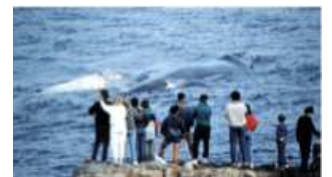
Whale Watching ad Hermanus

Sveglia e ritiro dell'auto a noleggio in città. Partenza verso le montagne Hottentots-Holland passando per il Passo di Sir Lowry . Visita della famosa vigna Hamilton Russel dove potrete assaggiare degli ottimi vini sudafricani. Durante la stagione delle balene (da giugno a dicembre), possibilità di effettuare ad Hermanus attività di Whale Watching lungo la scogliera o volendo anche su imbarcazione. Partenza dopo pranzo verso Swellendam , il terzo più antico insediamento del Sudafrica. Pernottamento in hotel a Swellendam.