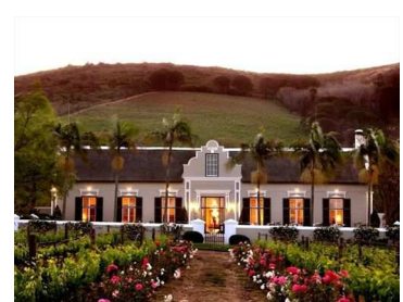
La Grande Roche

Rinominata in tutto il mondo e sempre più in espansione è la produzione vinicola sudafricana che proprio ad ovest di Cape Town, nella zona denominata Winelands, ha il suo massimo splendore. Partirete alla scoperta della celebre Wine Route in direzione Paarl . Giunti qui potrete visitare questa deliziosa cittadina per dirigervi poi verso l'azienda vinicola La Grande Roche; l'ambiente nobile ed elegante farà da cornice ad una stupenda degustazione di vini e ad un ottimo pranzo. Partenza nel pomeriggio verso Franschhoek , un'altra importante località della zona. Sull'omonimo fiume sorge l'azienda vinicola Haute Cabriere, specializzata nella vinificazione con metodo champenoise. Qui vi attende un'altra deliziosa degustazione dopodichè rientrerete in albergo per la cena. Pernottamento a Franschhoek .