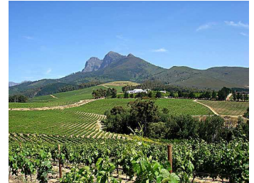
Marianne Wine Estate