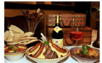
Cucina tipica sudafricana