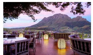
Delaire Graff Estate

Partenza verso Stellenbosch , la località più importante delle Winelands in cui potrete ammirare lo spettacolo di bellissime antiche case in stile olandese del Capo. Visita dell'azienda vinicola Delaire Graff Estate con degustazione di vini di grande produzione e pranzo. Nel pomeriggio visita dell'azienda vinicola Marianne Wine Estate con degustazione di vini di piccola produzione. Pernottamento a Stellenbosch .